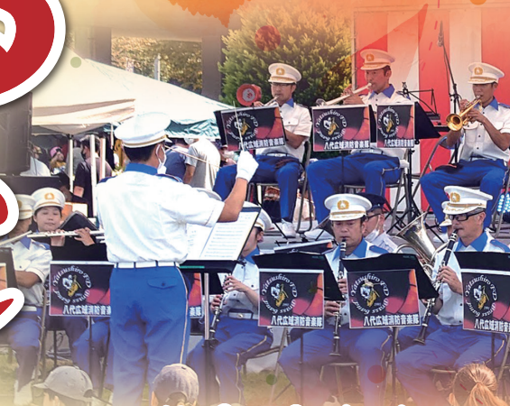
八代広域消防 音楽隊