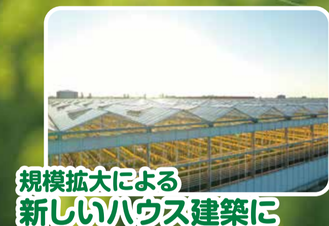
規模拡大による 新しいハウス建築に