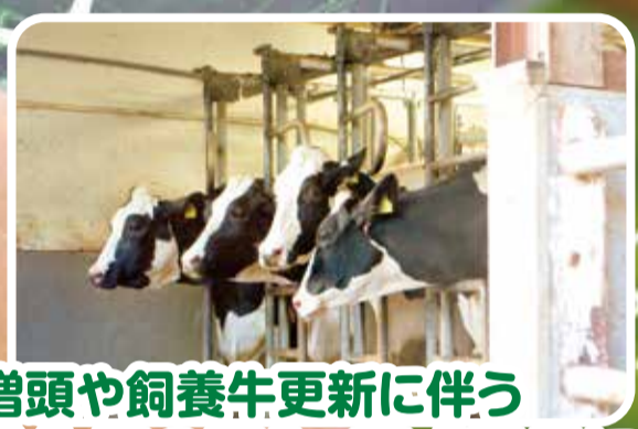
増頭や飼養牛更新に伴う 乳牛等の購入・育成費用に