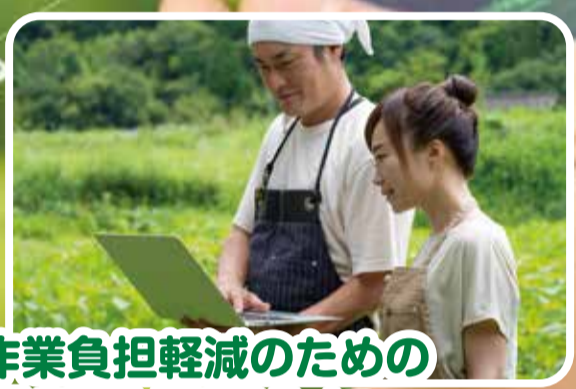
作業負担軽減のための 最新設備導入に